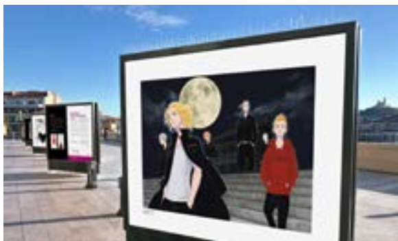
FIBD 2022-2023 - MARSEILLE ST-CHARLES