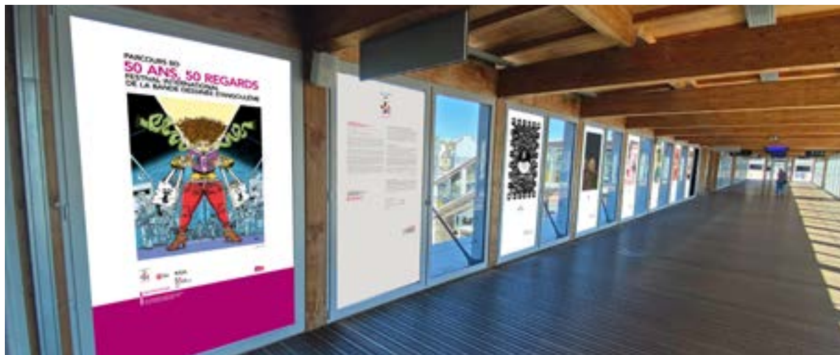
FIBD 2022-2023 - GARE DE LORIENT