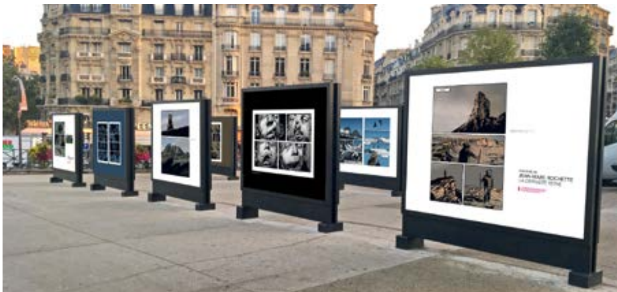
FIBD 2022-2023 - PARIS GARE DE LYON