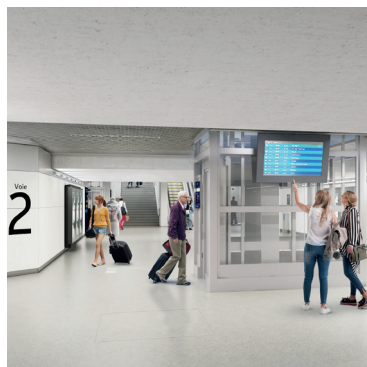
Vue d'artiste du souterrain modernisé © AREP / SNCF Gares & Connexions / Studio Miho