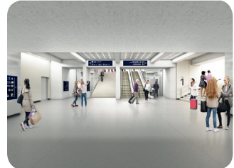
Vues d'artiste du souterrain modernisé