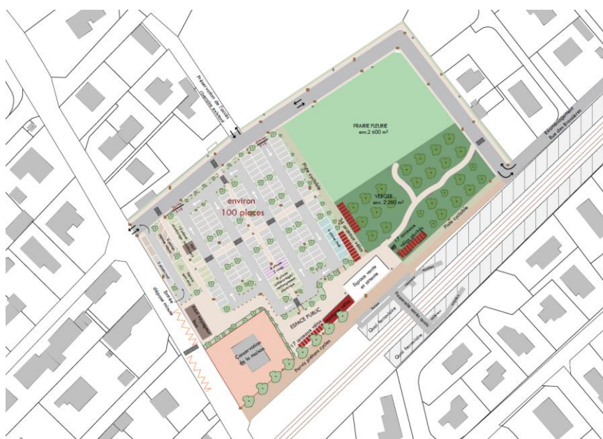
Schéma d'aménagement proposé

Le PEM sera implanté dans le cœur de la ville de Domène, entre les rues des Brassières et Marius Charles. Il accueillera des services de transport ferroviaires (partie ferroviaire) et de bus urbains et interurbains, un parc-relais, des services de mobilité (location de vélos, covoiturage, auto-partage...) et sera connecté à un réseau de cheminements piétons et de pistes cyclables (en cours d'étude par Grenoble - Alpes Métropole et la commune de Domène) (espace public).